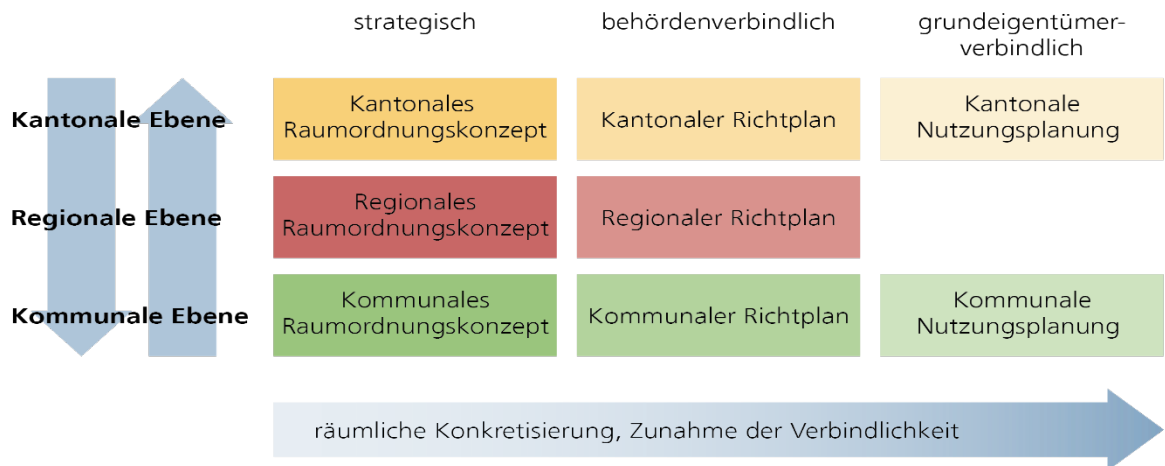
Abbildung 3: Planerischer Stufenbau im Kanton Zürich

Der RRP nimmt die Vorgaben des KRP auf und stimmt diese auf die Bedürfnisse, Zielsetzungen und Strategien der PZU ab. Er kann die räumlichen und sachlichen Ziele enger umschreiben oder bei Bedarf weitergehende Aufgaben enthalten (§ 30 Abs. 2 PBG). Die Aussagen des regionalen Richtplans werden in der kommunalen Richt- und Nutzungsplanung weiter verfeinert. Der regionale Richtplan ist ein behördenverbindliches Planungsinstrument.